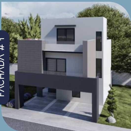
FACHADA # 1