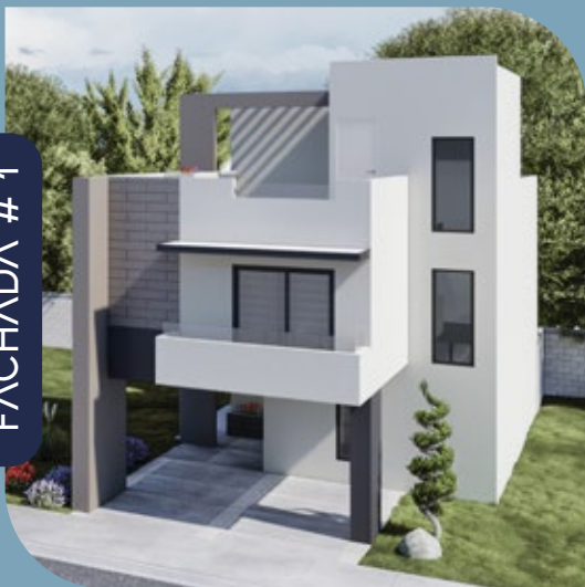
FACHADA # 1